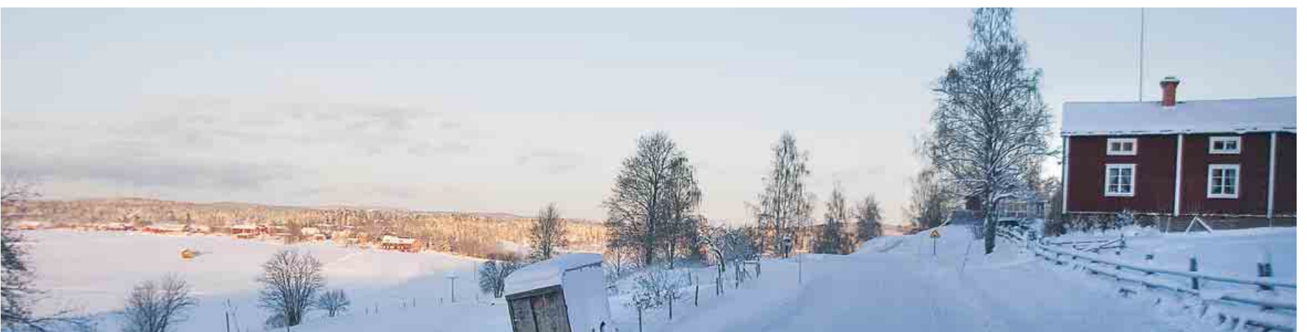
Lia heter en by i Hög. Den ligger i en lid som är en sluttning.